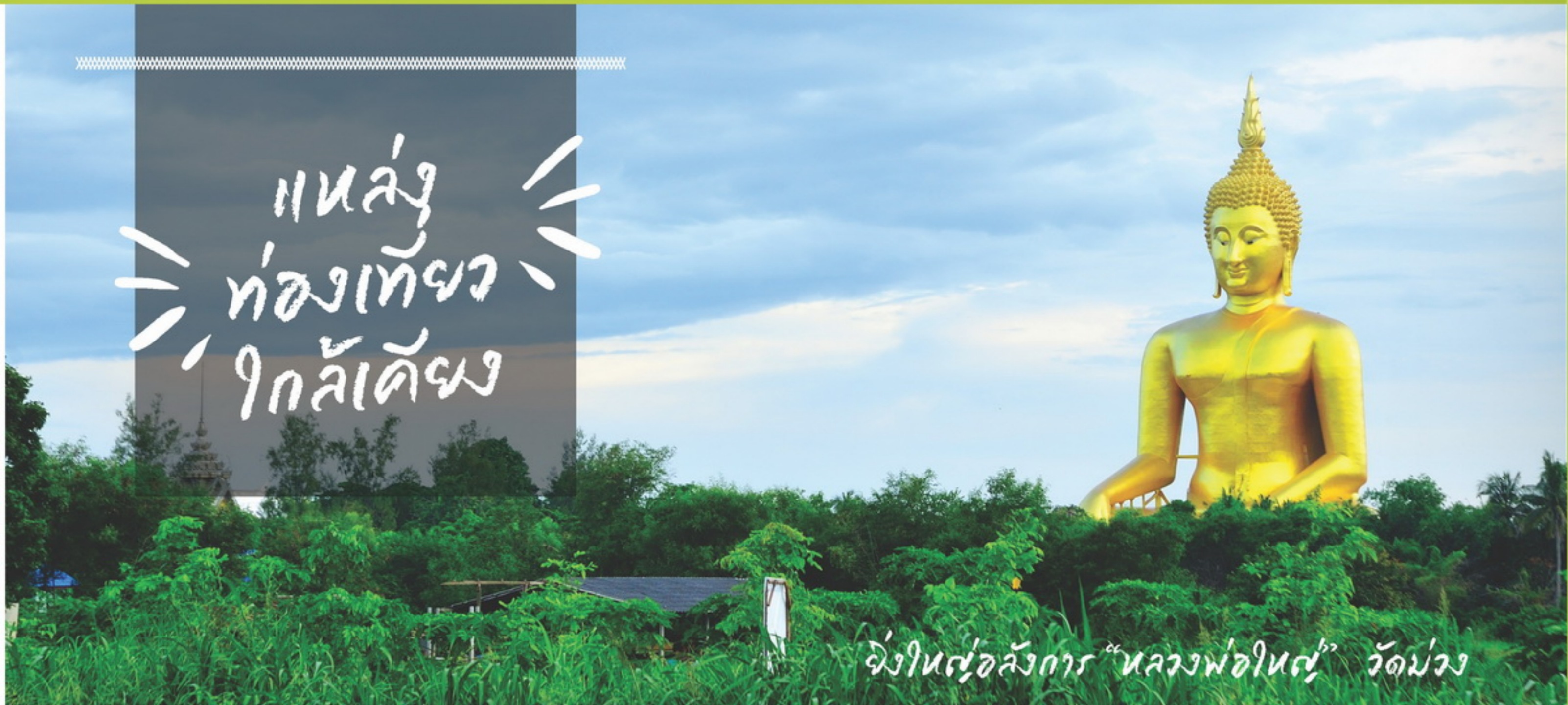
จังหวัดอุบลราชธานี “หลวงพ่ออินทร์” วัดม่วง