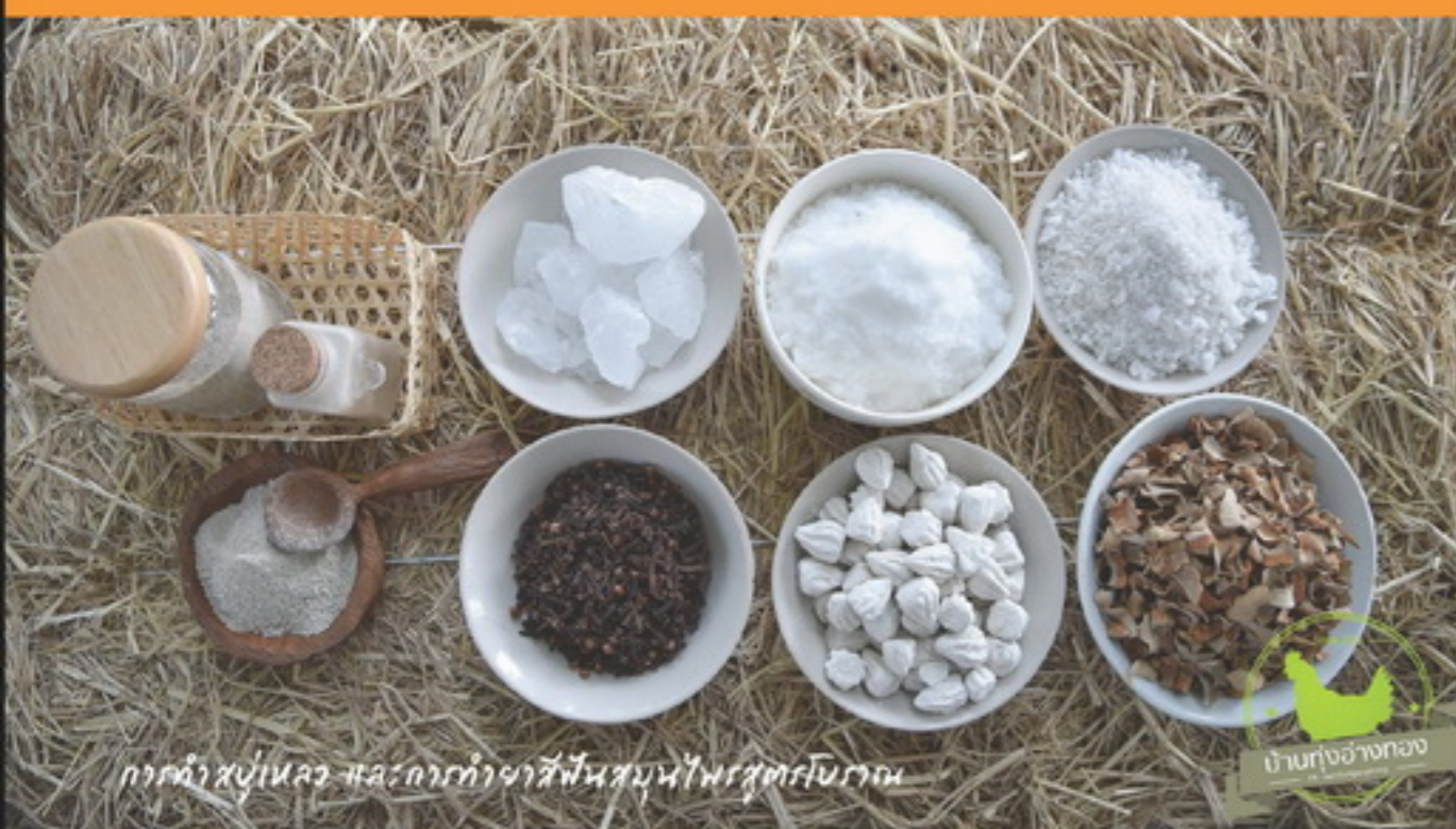
การทำขนมและการทำสารพัดประโยชน์จากดิน