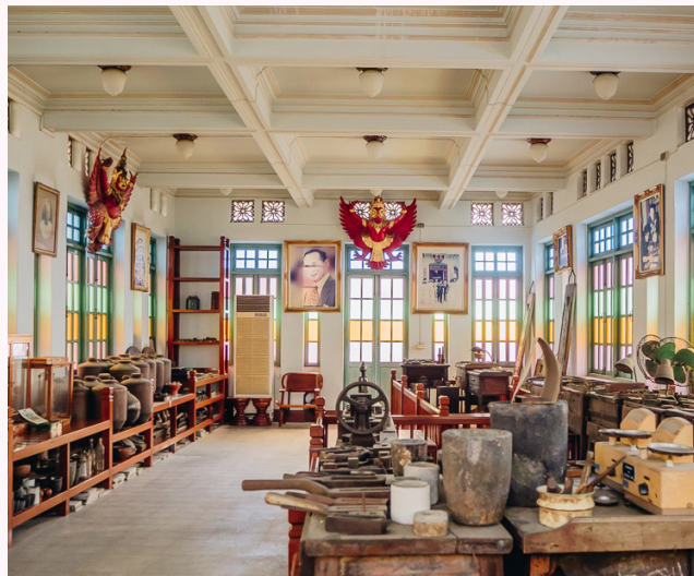
พิพิธภัณฑ์ทองคำ ห้างทองตั้งโต๊ะกัง