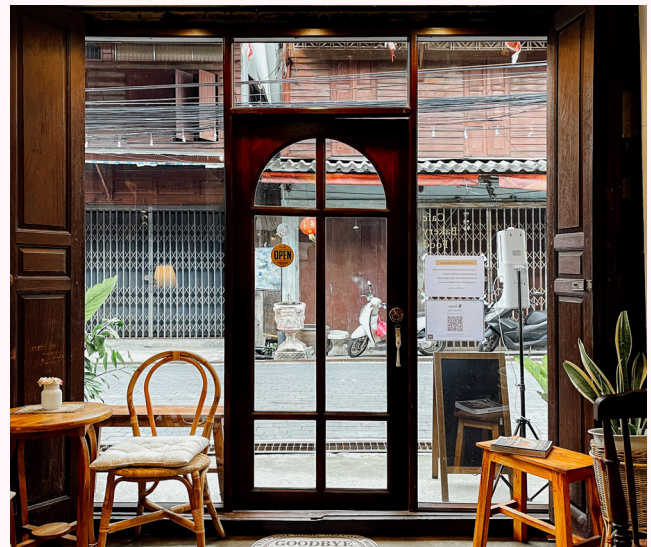
ย่านยมจินดา