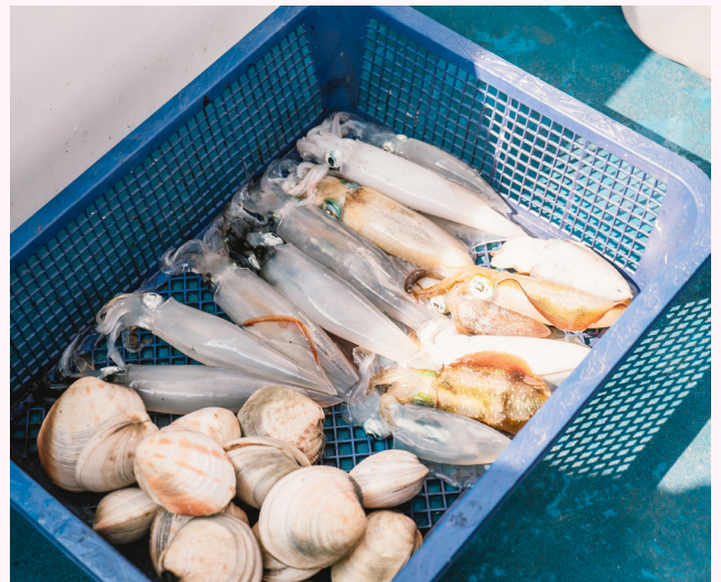
เกาะล้าน