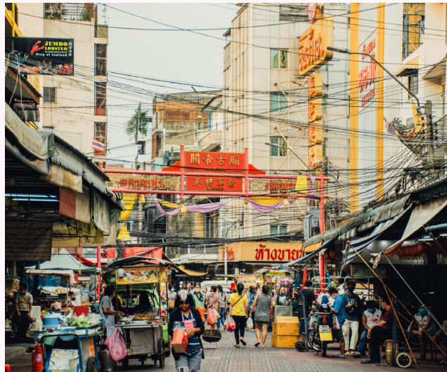
ย่านเยาวราชและสำเพ็ง