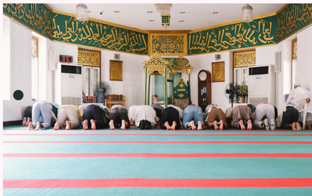
ชุมชนฮารูน

ห้องสมุดสำหรับเด็กปฐมวัยแห่งแรกของประเทศไทย ตั้งอยู่ในอาคารเก่าแก่อายุกว่าร้อยปี รายล้อมไปด้วยสนามหญ้า ต้นไม้ ร้านกาแฟ และสนามเด็กเล่น เหมาะสำหรับบุคคลทั่วไปทุกคนที่ต้องการความเงียบสงบ ภายในห้องสมุดถูกออกแบบมาเพื่อสนับสนุนการทำกิจกรรมร่วมกันของคนในครอบครัว