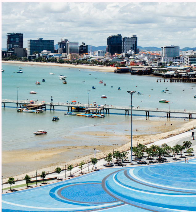
ชายหาดพัทยา