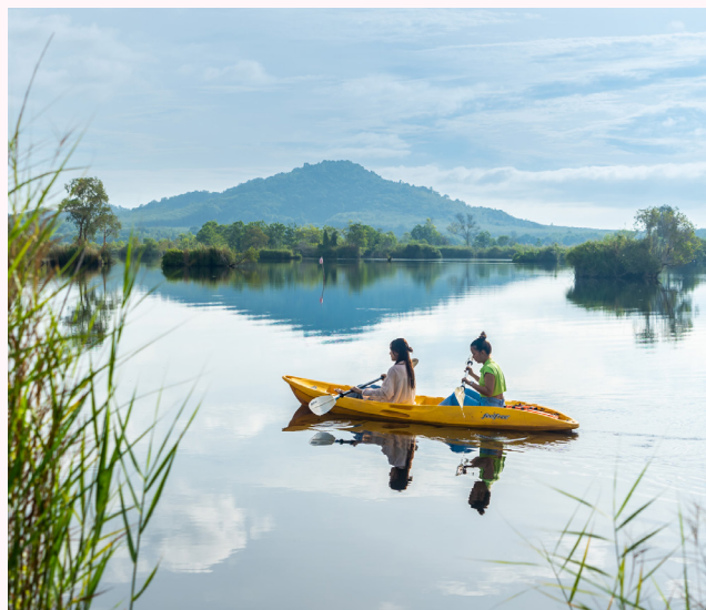
สวนพฤกษศาสตร์ระยอง