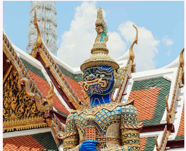
วัดพระศรีรัตนศาสดาราม หรือวัดพระแก้ว