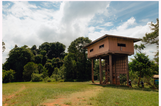
อุทยานแห่งชาติเขาใหญ่