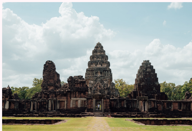
อุทยานประวัติศาสตร์พิมาย

ปราสาทหินทรายสีขาวขนาดใหญ่ โบราณสถานสำคัญของจังหวัดนครราชสีมา ซึ่งเป็นศาสนสถานในพุทธศาสนานิกายมหายาน สร้างขึ้นในช่วงกลางพุทธศตวรรษที่ 16