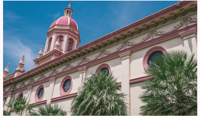
โบสถ์ข้างตาคูร์ส

วัดประยูรวงศาวาส พระอารามหลวงชั้นโทชนิดวรวิหาร พร้อมสักการะ พระบรมธาตุมหาเจดีย์ที่มีความสวยงามจนได้รับ รางวัลอนุรักษ์ศิลปสถาปัตยกรรมดีเด่น ประจำปี 2553