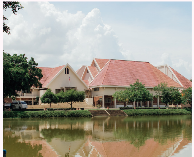
พิพิธภัณฑ์สถานแห่งชาติพิมาย