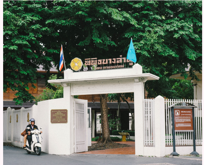
พิพิธบางลำพู