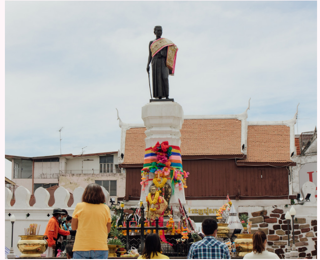
อนุสาวรีย์ท้าวสุรนารี