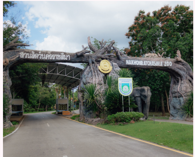
สวนสัตว์นครราชสีมา