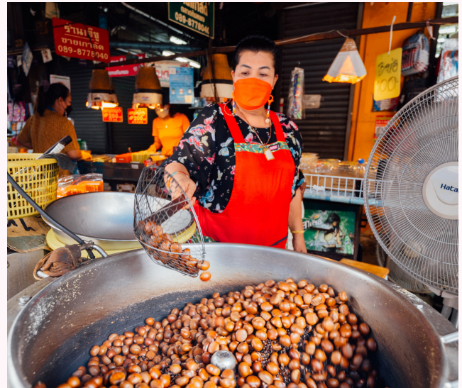
ตลาดกิมหยง