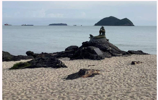
หาดสมิหลา

หาดสมิหลา ชมทัศนียภาพที่งดงามของเกาะหนูและเกาะแมว พร้อมถ่ายรูปเช็คอินกับรูปปั้นนางเงือกสีทอง สัญลักษณ์ที่สำคัญอย่างหนึ่งของหาดสมิหลาและจังหวัดสงขลา ก่อนจะปิดท้ายวันด้วยการรับประทานอาหารเย็นที่ท้องถื่นบริเวณใกล้หาดสมิหลา