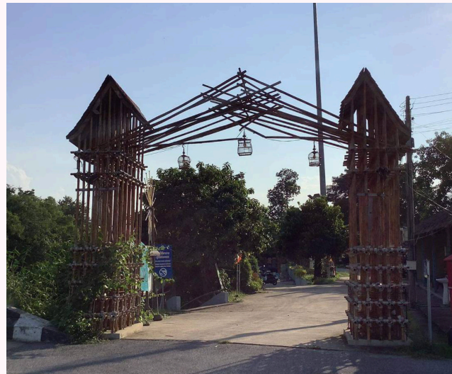
ตลาดน้ำคลองแห

แวะซื้อของฝากจากตลาดยอดนิยมของหาดใหญ่ ซึ่งมีการสับเปลี่ยนผลิตภัณฑ์ขนานสินค้าหลากหลายชนิด อยู่ตลอดทั้งวันในแต่ละช่วงเวลา