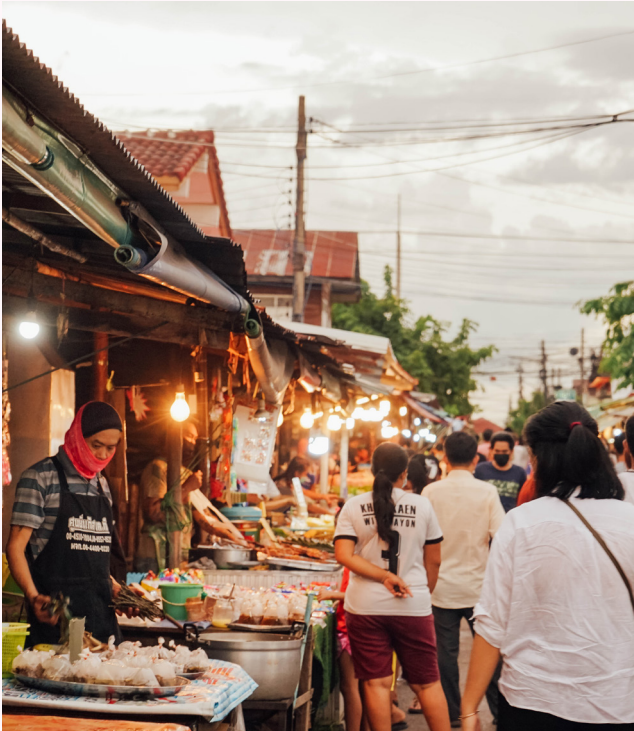
ตลาดบ้านคำไฮ

ตลาดบ้านคำไฮ ตลาดสดตอนเย็นที่ใหญ่ที่สุดในขอนแก่น ซึ่งเต็มไปด้วยอาหารชั้นเลิศ ไม่ว่าจะเป็นอาหารพื้นถิ่นอีสานหรืออาหารรสเด็ดจากทั่วประเทศ ทั้งควาและหวานในราคาขอมเยา