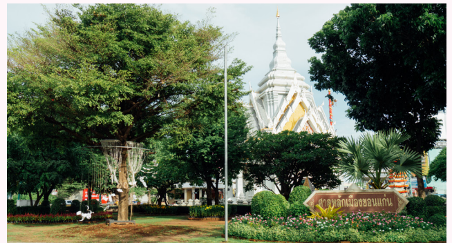
ศาลหลักเมืองขอนแก่น

ตลาดกลางเมืองที่ร่มรื่นน่าเดินด้วยบรรยากาศของบึงและสวนสาธารณะ ซึ่งมีชื่อเสียงด้านอาหารที่ดีต่อสุขภาพให้เลือกทานหลากหลายเพื่อตอบโจทย์ผู้ที่มาออกกำลังกายที่บึงแก่นนคร