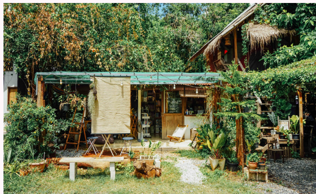
Columbo Craft Village

เมื่อขึ้นรถแล้ว ใช้เวลาเดินทางประมาณ 20 นาที