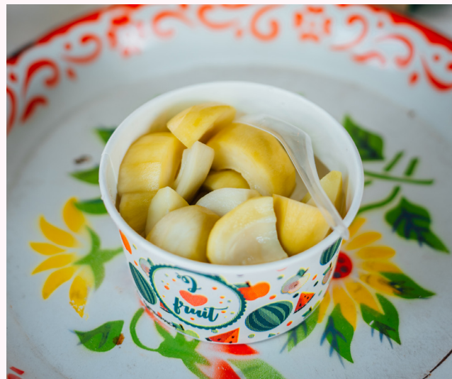
สวีทแมงโก้ม่วงเบาแช่อิ่มหาดใหญ่