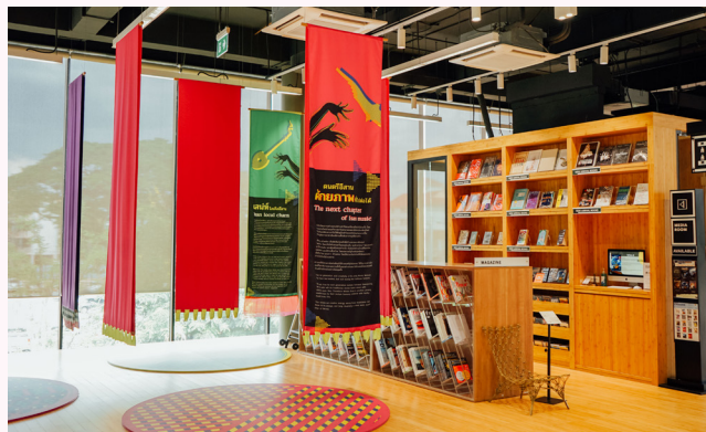
TCDC Khon Kaen