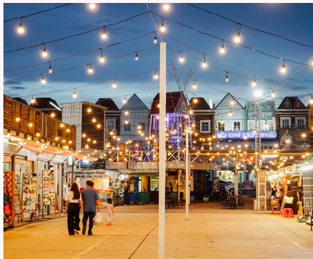
ตลาดต้นตาล