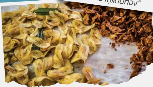
"กลัวยเบรทแตก"