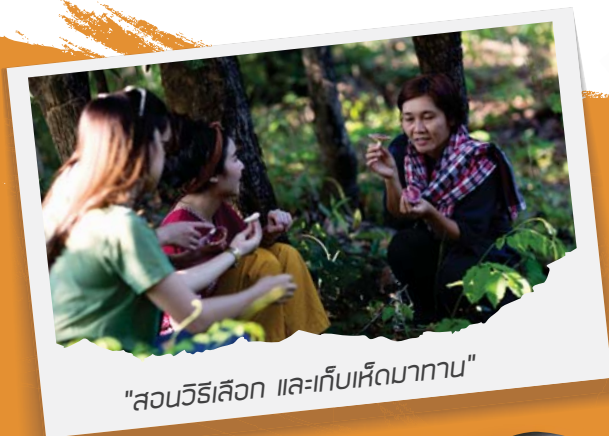
"สอนวิธีเลือก และเก็บเห็ดมาทาน"

ออกจากป่าก็มาสวมบทชาวประมงกันต่อ เราจะไปตั้งจ้ายกยอกัน มันคือการออกล่าหาปลาด้วยยอกที่เป็นอุปกรณ์ตาข่ายรูปสี่เหลี่ยม ซึ้งด้วยลำไม้ไผ่ เวลาใช้ต้องยกแห้วยกลงไปในน้ำ ขอบอกว่ายากจนเมื่อไหร่แล้วเมื่อไหร่อีก ไม่เห็นมีปลาไซร้ยามาติดสักตัว ไม่เห็นเหมือน ชาวบ้านมวนเขา แห้วยกที่โรปลาติดเอาๆ ของอย่างนี้คงต้องอาศัยความชำนาญ