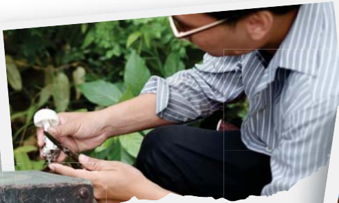
"เข้าป่าตามล่าหาเห็ด"