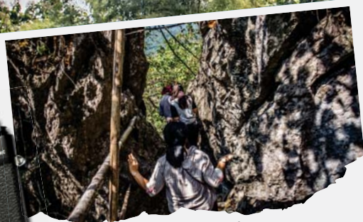
"ถ้ำถ้ำสาส์"