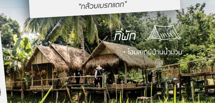
"โฮมสเตย์บ้านน้ำมวบ"