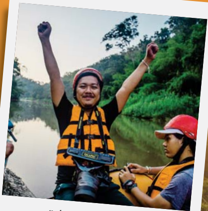
"ล่องแก่งน้ำว้า"

จากยอดพระธาตุเดินกลับลงมาคราวนี้เราจะไปแวะเข้าถ้ำ ถ้ำที่เปิดให้เข้าชมตอนนี้มีแค่ถ้ำพระ ซึ่งมีความยาวกว่า 60 เมตร ทางลงนั้นเป็นบันไดเหล็กทั้งหมด 171 ขั้น ชั้นไม่น้อยขบกว่าต้องใช้สติในทุกย่างก้าว พอเข้ามาในถ้ำถ้ำก็จะเจอกับฝูงค้างคาวกว่าหมื่นตัวที่อาศัยอยู่ในถ้ำ ใต้บรรยากาศการผจญภัยตามลำห้วยชมทรัพย์กันราวกับเป็นอินเดียน่าโจนส์