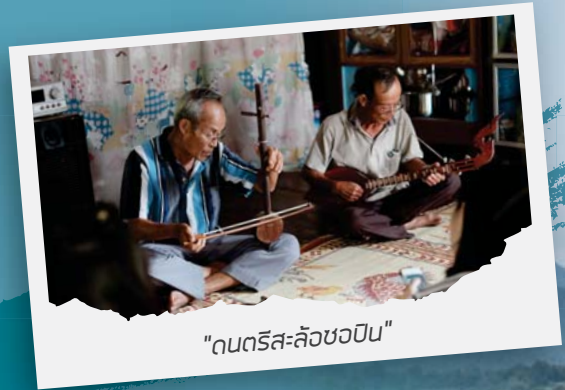
"ดนตรีสะล้อซอปิน"

นอกจากอาหารแล้วยังซบคล้อมกันอย่างดีด้วยเสียงดนตรี สะล้อซอปินจากเหล่าผู้ใหญ่ในบ้าน และการแสดงจากน้องๆ นักเรียนหน้าใส ที่ประทับใจที่สุดคือตอนผูกข้อมือ โดยพ่ออู๊ยแม่อู๊ยในตำนานทำให้พี่ลให้พรพุดคุยต้อนรับเรา เหมือนอย่างลูกอย่างหลานจริงๆ เสียงพ่อกับแม่อ่อนโยน และใจดีมากจนขอฝากตัวเป็นลูกหลานบ้านน้ำมวบ ไปเรียบร้อยแล้ว