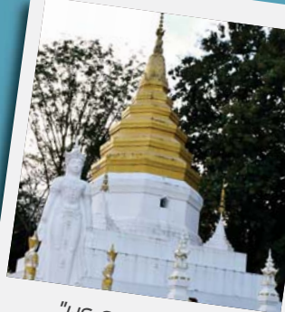
"พระธาตุแดนทอง"