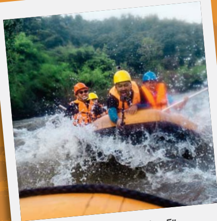
"ผจญภัยสุดมันส์"