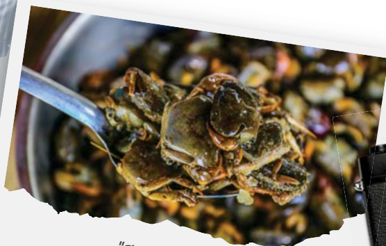
"สอนการทำน้ำบู"