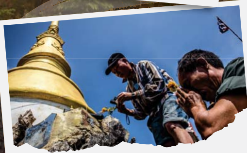
"พระธาตุพบโขก"

เก็บความประทับใจด้วยประสาทสัมผัสทั้ง 5 ให้เต็มที่แล้วกลับลงมาเติมพลังด้วยอาหารมื้อกลางวันทีชาน้ำนมบจกเตรียมชุดใหญ่ไว้ให้เพราะบ่ายนี้โปรแกรมเด็ดคือล่องแก่งน้ำว้าที่เขียนล่องแก่งว่ากันว่าเราใจระทึกเกือบไฟว์ของเอเชียกันเลยทีเดียว ใจที่เคยล่องกันมานั้นถือว่าเป็นระดับประถม เตรียมความพร้อมกันมาเต็มที่ ซูชิพร้อม หมวกกันน็อคพร้อม กระเป๋ากันน้ำพร้อม คราวนี้ก็ลุยกันเลย! ละอองน้ำกระเซ็นเข้าหน้ามันจริงมากจนรู้สึกได้ถึงบรรยากาศการล่องแพไม้ไผ่ของป่าของเหล่าพรานแถบนี้ในสมัยก่อน การันตีความเปียก ความมันส์ ความจมน้ำแบบไม่กันตั้งตัว เอ๊ย แบบนี้สิใช่!รสชาติของการล่องแก่งที่แท้จริง เวลาสองชั่วโมงผ่านไปแบบไม่ทันนับรู้ตัวอีกทีก็มาถึงปลายทางแล้วพร้อมกำลังแขนที่ล้าแบบอยากจะทำอะไรทุกอย่างหมดตัวนะ