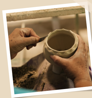
งานปั้นเซรามิคขั้นสวย ที่จังหวัดลำปาง