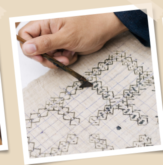
เรียนรู้อริยศิลป์เขียนเทียน จากจังหวัดเชียงใหม่