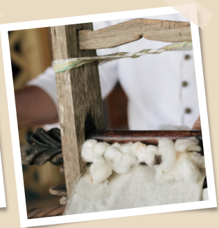
ปั่นฝ้ายมาทอเป็นผืน ที่จังหวัดลำพูน