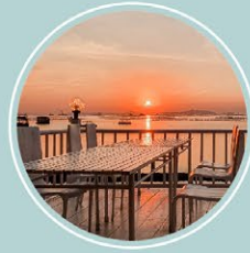
ร้านอาหารบ้านเคียงเล