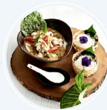
ร้านอาหารประณีต