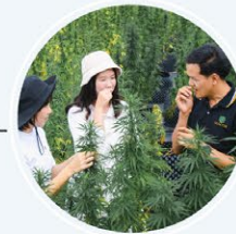
มิราเคิล แคนนาบิส แลนด์ (เลเจนด์สยาม)