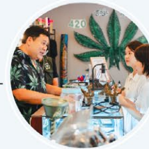
ร้านกัญชา วิช