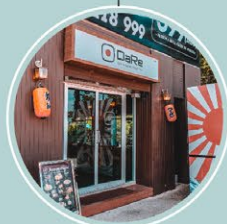
โรงแรมดีวารี จอมเทียน มิช พัทยา