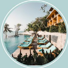
เคป ดารา รีสอร์ท พัทยา