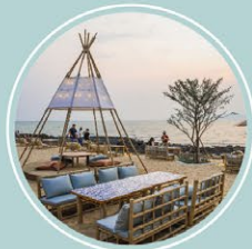
ดี ออกซิเจน บีชพรีอาร์ท ไอเอซิส