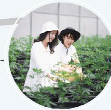
โกเลเด็นส์ฟ เอม