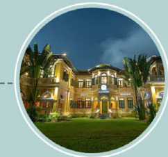
ร้านอาหาร บลู เอเลเฟ้นท์ภูเก็ต