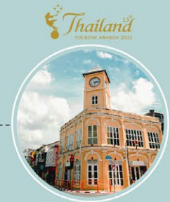
ชุมชนท่องเที่ยว ย่านเมืองเก่าภูเก็ต