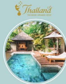
โรงแรมบันตรา ลายัน ภูเก็ต รีสอร์ท