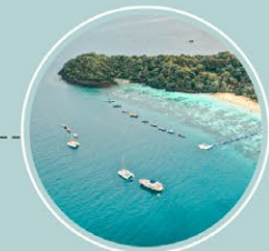
บานาน่าบีช เกาะเฮ