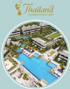
ภูเก็ต แมริออท รีสอร์ท แอนด์ สปา, ไนยาง มิช