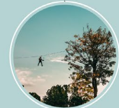
หุบมานเวิลด์