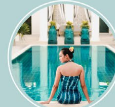
โอเอซิส เทอร์ควอยซ์ โคฟว สปา