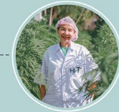
วิสาหกิจชุมชนสมุนไพรและท่องเที่ยวเชิงสุขภาพ (ภูเก็ต)