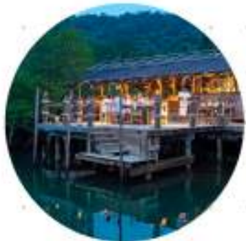
ครัวแม่ตุ๊ก