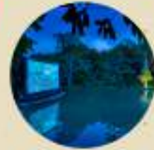
Private Cinema Paradiso