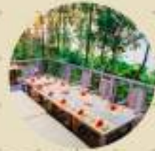
The Dining Room