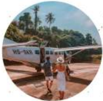
เครื่องบินส่วนตัว